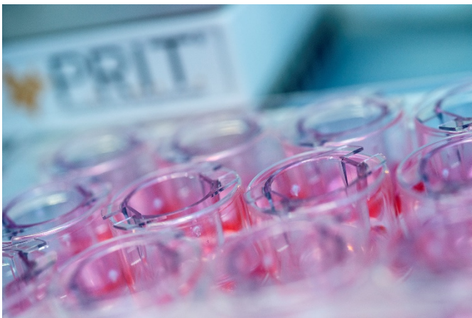
Abb. 1 Mit dem am Fraunhofer ITEM entwickelten Expositionsgerät P.R.I.T. ® ExpoCube ® können verschiedene Klassen inhalierbarer Substanzen mit hoher Reproduzierbarkeit und ausreichender Dosiskontrolle geprüft werden.